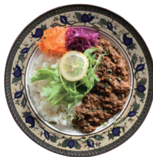
Spicy European Style Curry with Brown Rice + 500