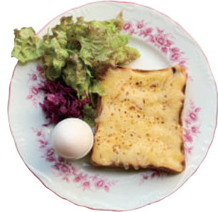
Fried Ham + 550 & Cheese Sandwich