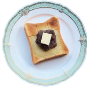
Buttered Toast + 450 with Sweet Bean Paste